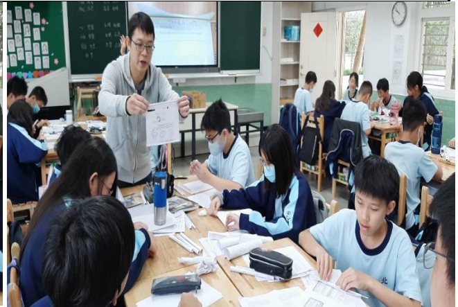
請學生利用紙裁切出建物結構材料