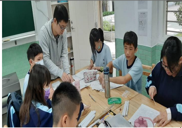
請學生利用紙裁切出建物結構材料