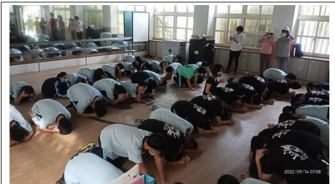
111 年 9 月 14 日防空避難演練情形—三樓班級疏散至一樓教室。