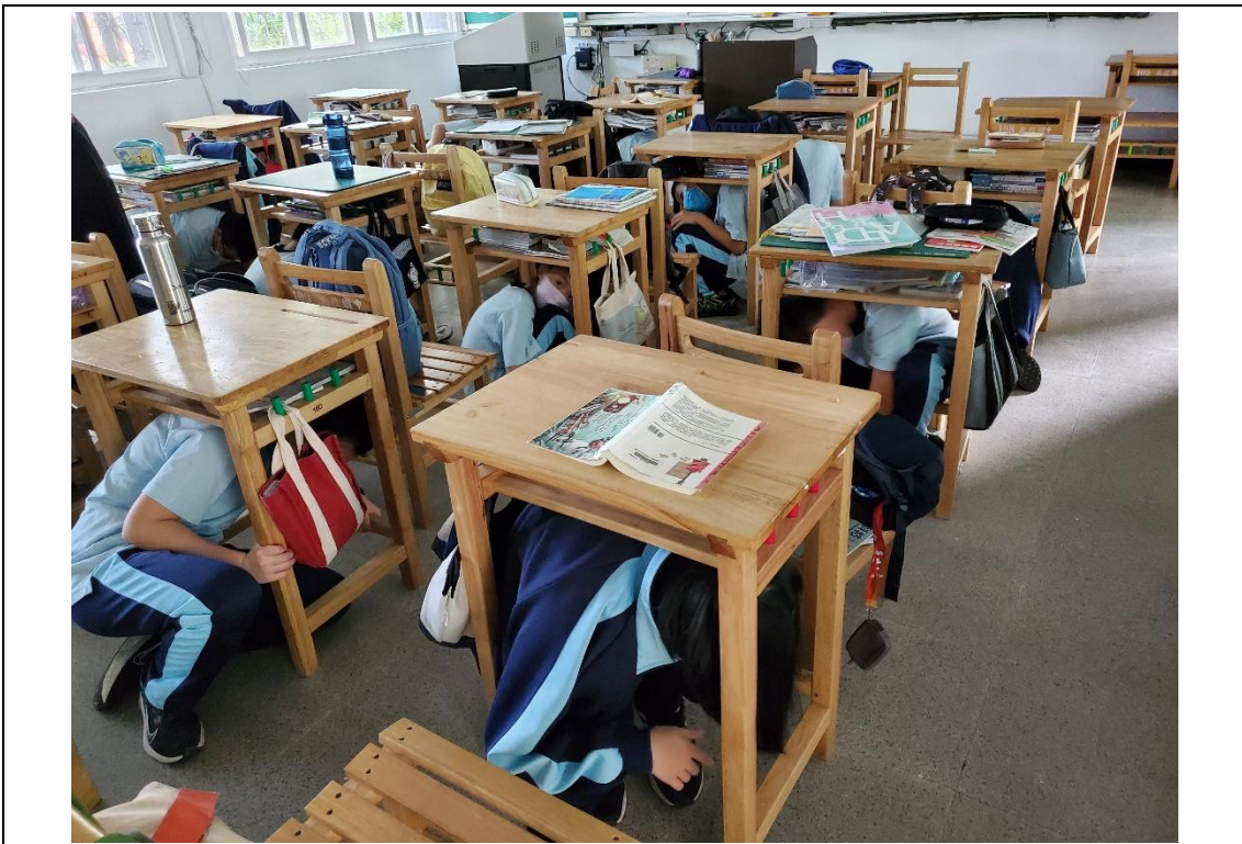
111 年 9 月 20 日防震避難演練情形—就地掩蔽。