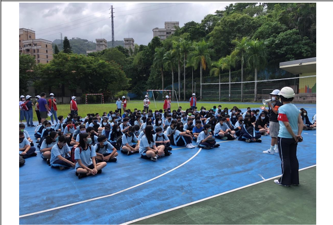
111年9月21日複合式防災演練情形—集合并清查人數。