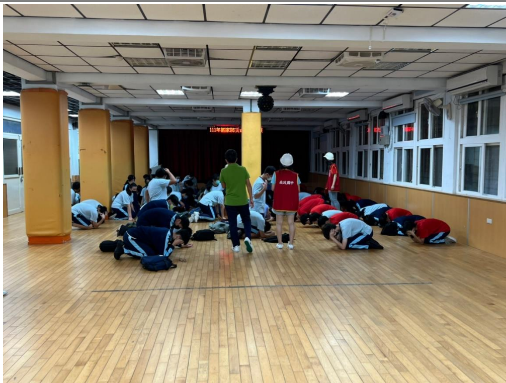
111 年 9 月 14 日防空避難演練情形—三樓班級疏散至一樓教室。