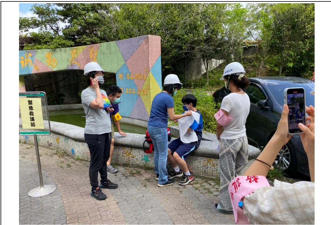
111年9月21日複合式防災演練情形—救護組包紮傷患。