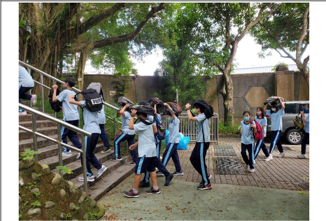
111 年 9 月 20 日防震避難演練情形—避難疏散。