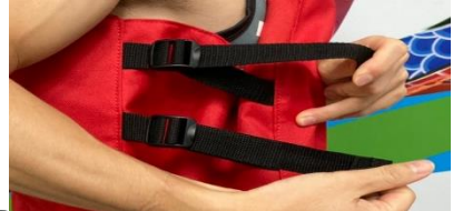
2 腰部左右各2條帶子拉緊