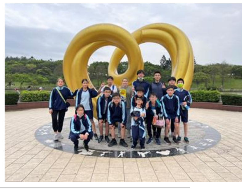
臺北市立北政國民中學110學年度第1學期體育發展暨健康促進會議