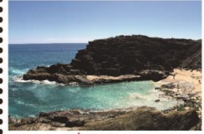
† 蘭嶼 - 岬