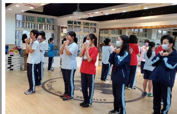
舞蹈社體認身體各部位的動能，並流暢執行舞蹈基本動作