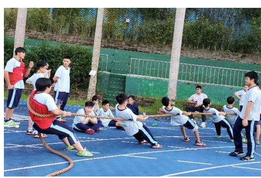
拔河社參與教育盃拔河比賽榮獲男子組第三名、女子組第二名