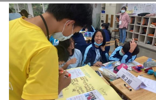
北政觀點社帶領學生認識新聞媒體與報導產製過程