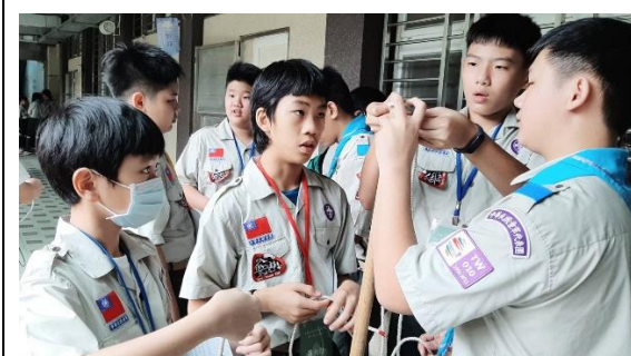
童軍社員加入童軍團，每月團集會初級考驗是必經過程。