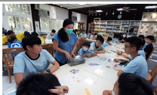
桌遊社培養學生思考勝利模式的最佳策略