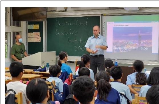
德國文化社與德國外交駐台代表交流，學習德語瞭解歐洲旅遊美食