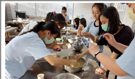
點心製作社手腦並用，除了製作出美味的食物，更注重衛生與色香味