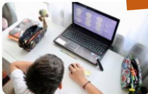
網路課程 - OnO