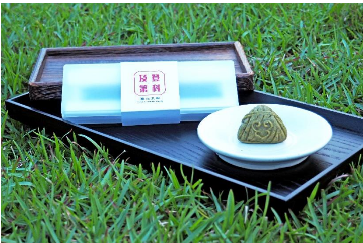
▲憑證(本年度准考證、報考證明或影本)兌換登科及第祈福文具組及如意包中糕