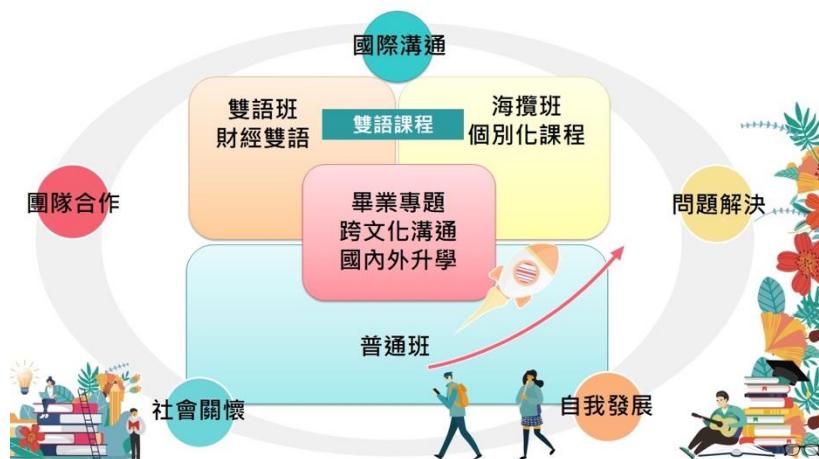
圖：本校課程與海外子女攬才班課程關係圖

本課程地圖，利用本校海外攬才子女專班的師資與教材資源，與海攬班的學生特殊的文化背景結構結合，並且透過校訂必修、團體活動時間與普通班的學生進行形式與非形式的交流，達到陽明學生與海攬學生雙贏的績效。