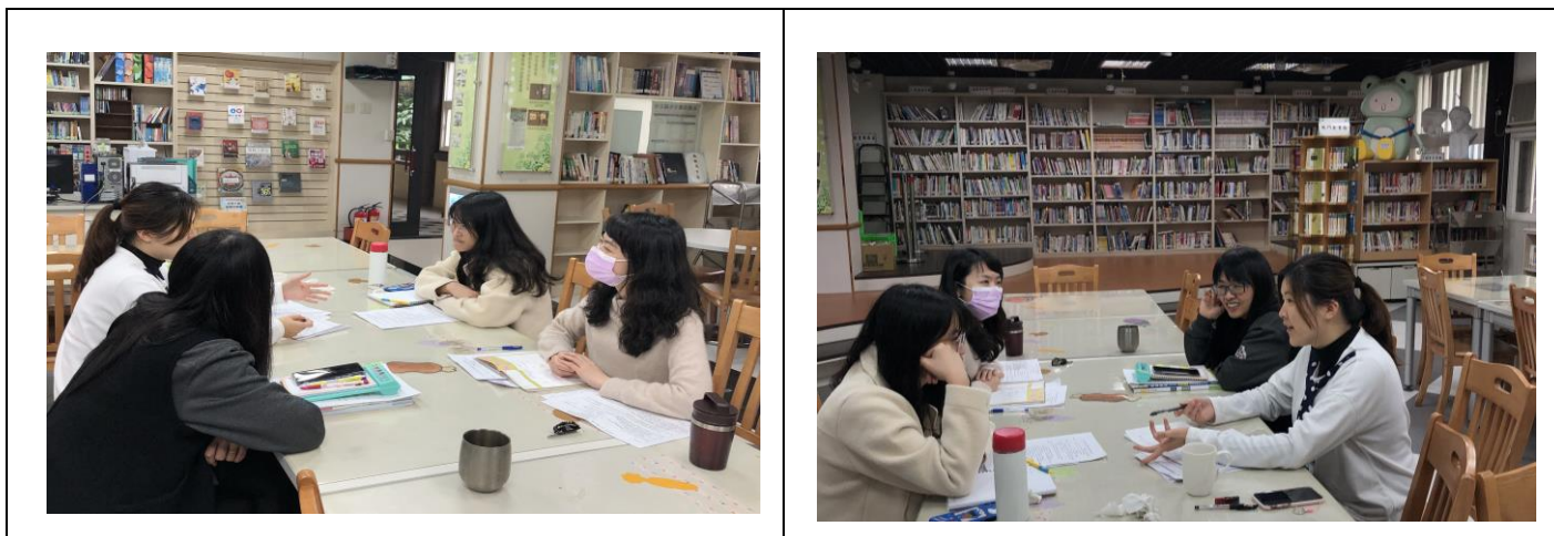
領域老師討論過程