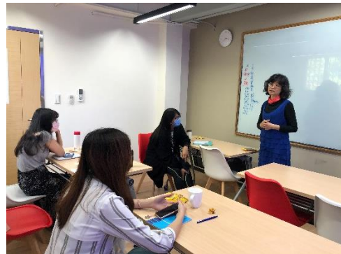
領域教師專注聆聽