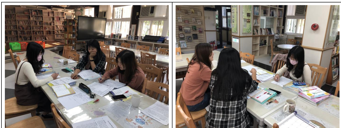
領域老師討論過程