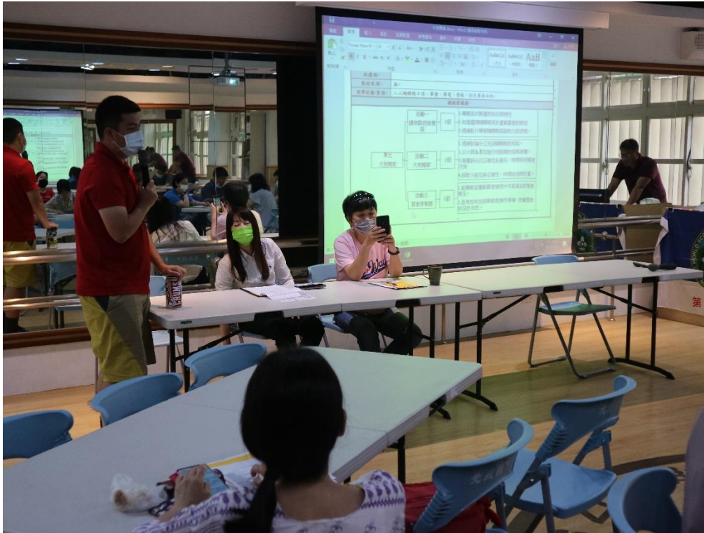
照片說明：04/22 前導學校公開觀課-童軍老師進行說課。