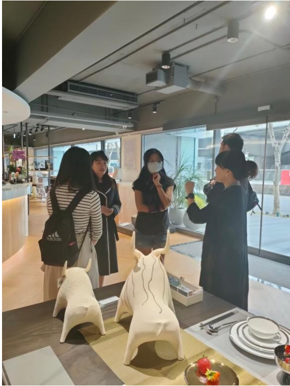
照片說明：03/18 俊欣行校外參訪，由經理解說餐桌的擺飾可以凸顯飯店或者主人家的風格和氣勢。