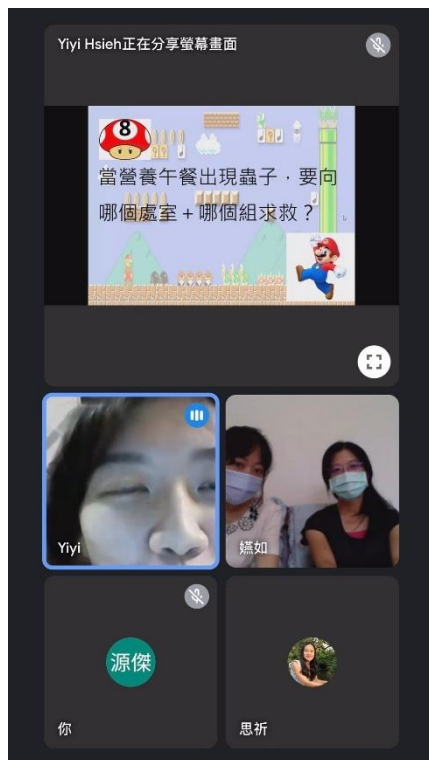
照片說明：06/23 因應疫期改為線上 google meet 研習分享輔導科特色課程。