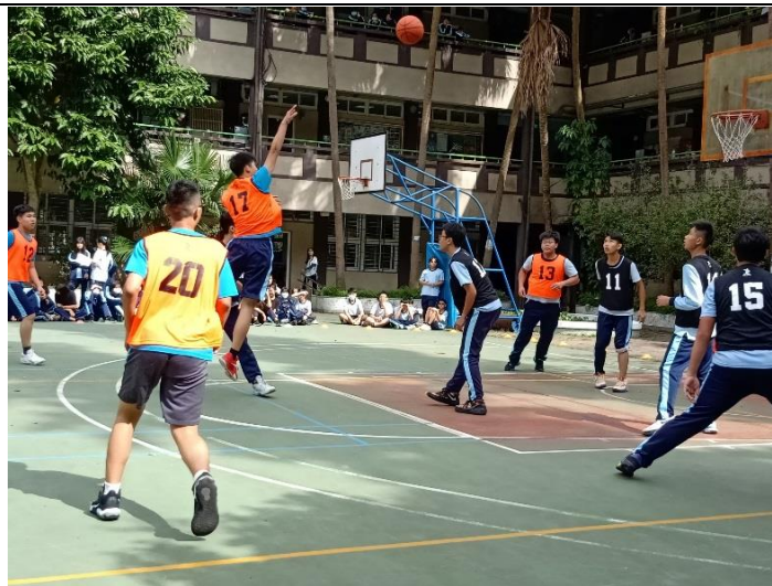
班際籃球賽團應用