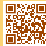
更多詳情請參考 公教個人專戶制專區