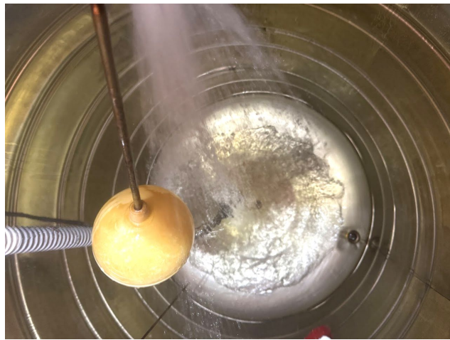
清 洗 後