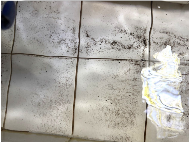
下 水 塔